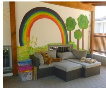
Ruhebereich im Garten