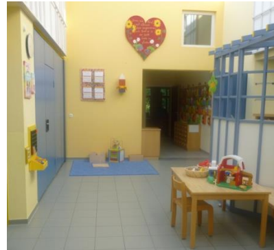
Eingangshalle mit Garderoben

Drei Dinge sind uns aus dem Paradies geblieben: die Sterne der Nacht, die Blumen des Tages und die Augen der Kinder.